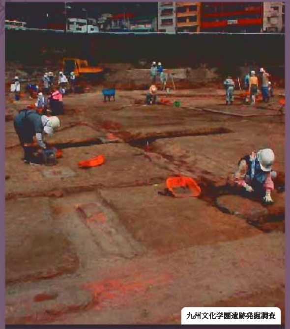
九州文化学園遺跡発掘調査