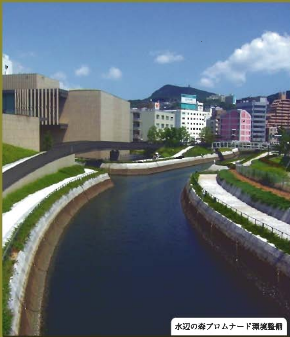
水辺の森プロムナード環境整備

リサイクル流通に乗らない廃棄物の適性処理、個人情報やプライバシーに関する機密文書の処理など小型焼却炉のニーズが高まっています。