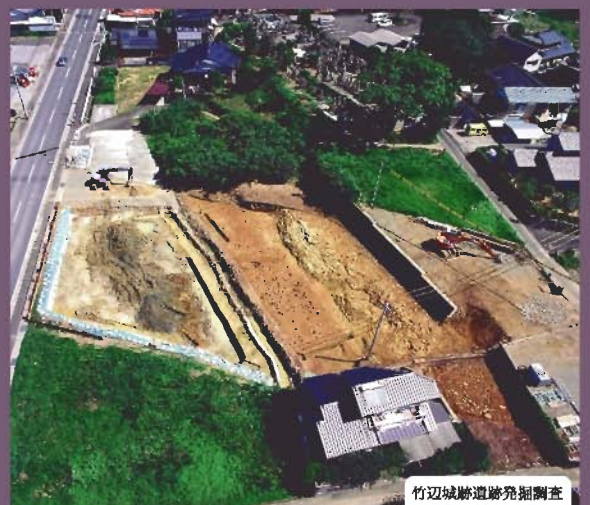
竹辺城跡遺跡発掘調査